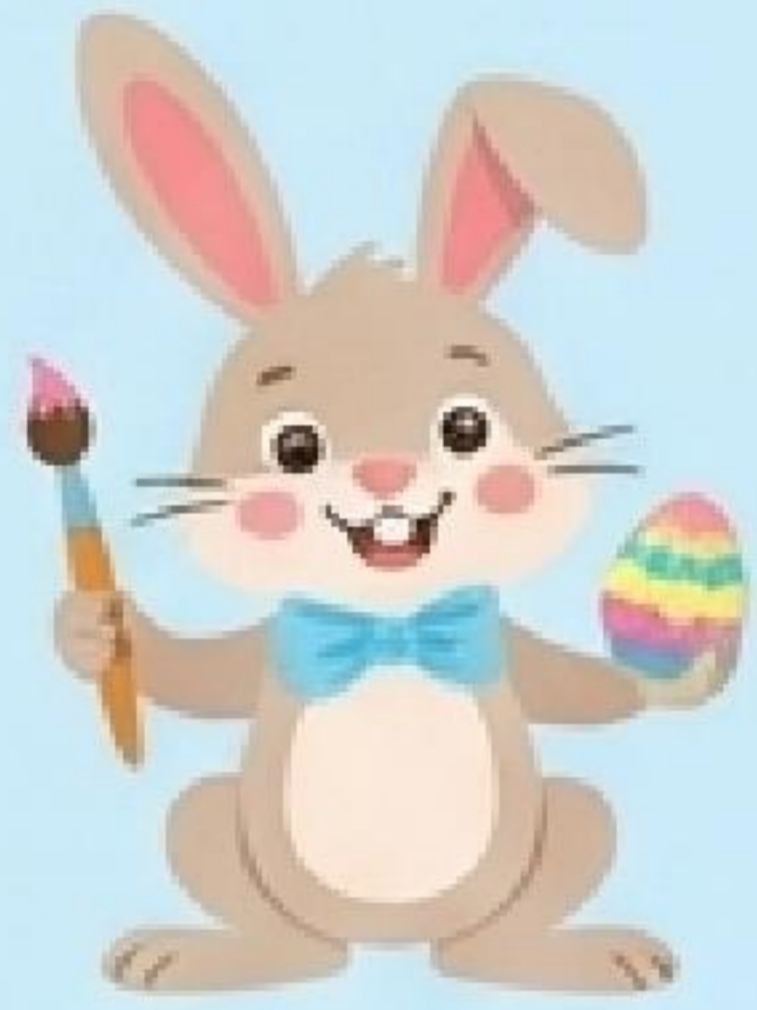
Easter Bunny (Osterhase)