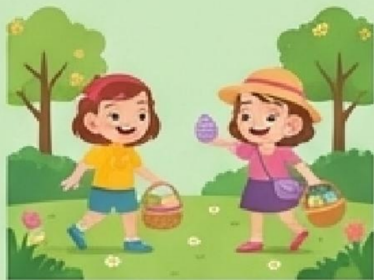
egg hunt (Eiersuche)