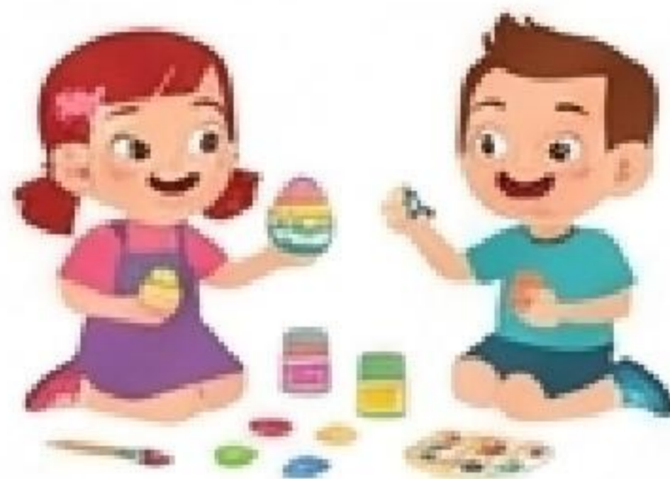
decorate eggs (Eier verzieren)