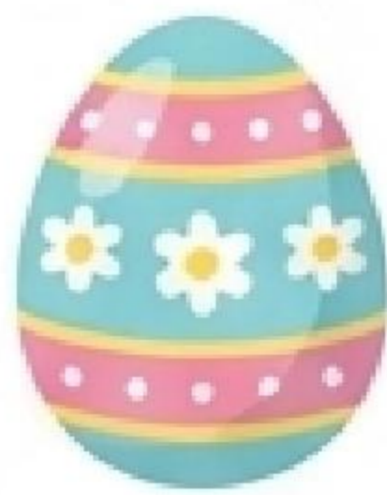
Easter egg (Osterei)