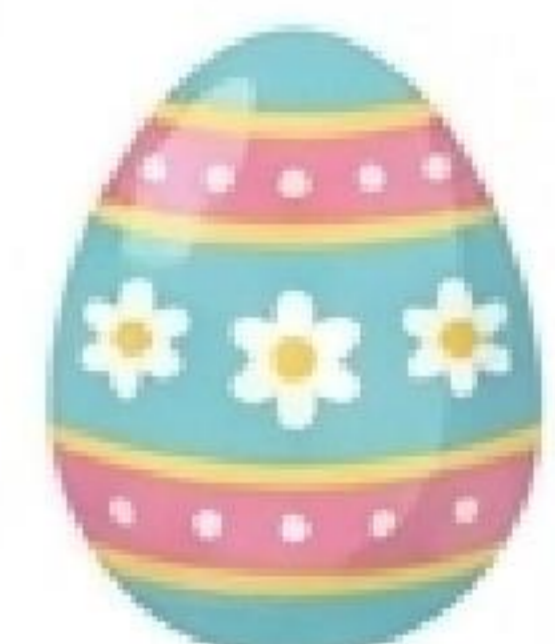
Easter egg (Osterei)