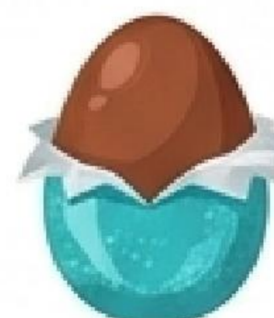
chocolate egg (Schokoladenei)